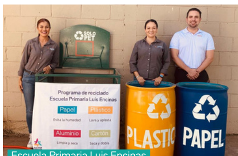
Escuela Primaria Luis Encinas

En Jalo por Obregón creemos que fomentar una cultura del reciclaje desde las escuelas es fundamental para construir una comunidad más limpia, consciente y sostenible.