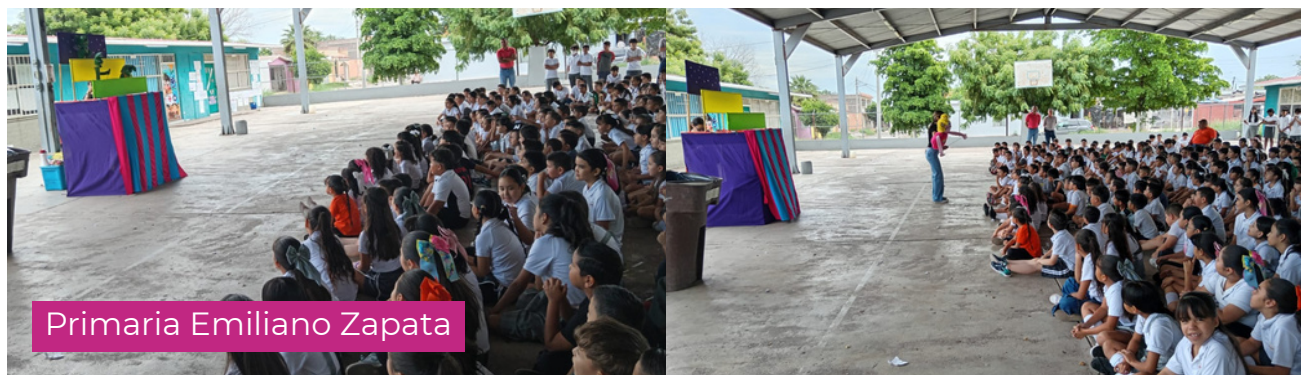
Primaria Emiliano Zapata