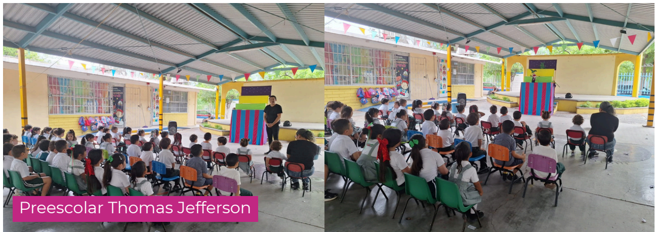
Preescolar Thomas Jefferson