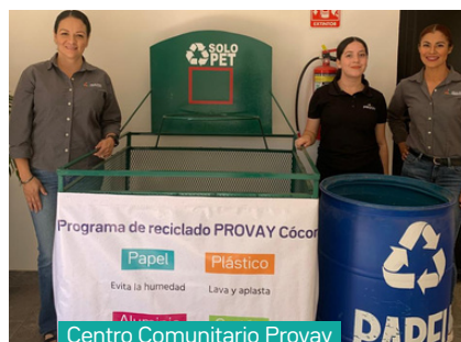
Centro Comunitario Provay