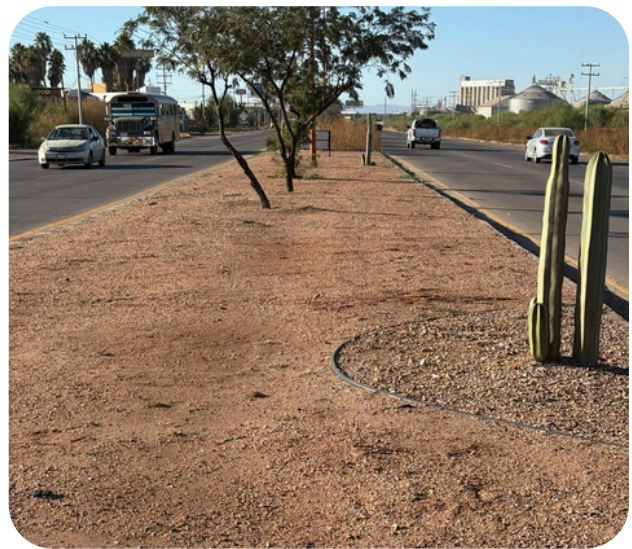
Carretera mantenido por Carls Jr